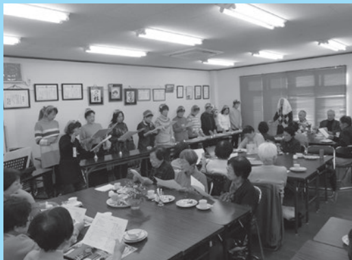
▲小地域福祉会の活動(交流会)