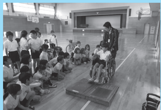
▲出前講座（不自由さの体験）