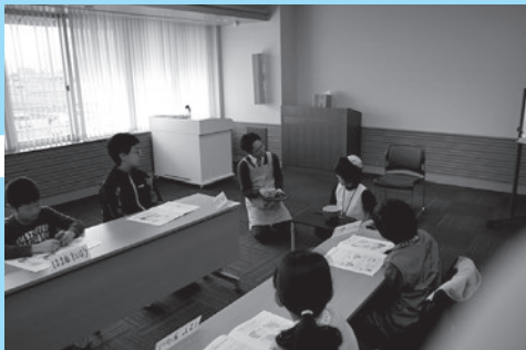
▲福祉教育セミナー