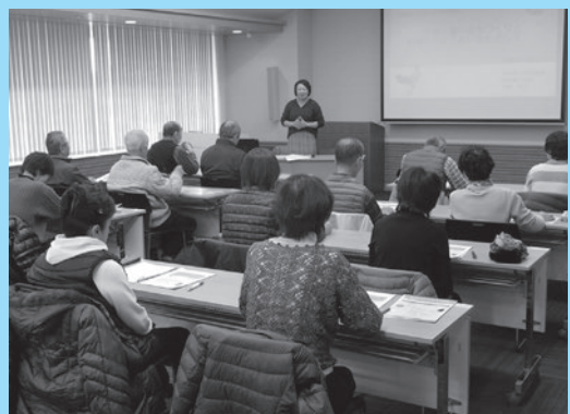
▲災害ボランティア体験講座