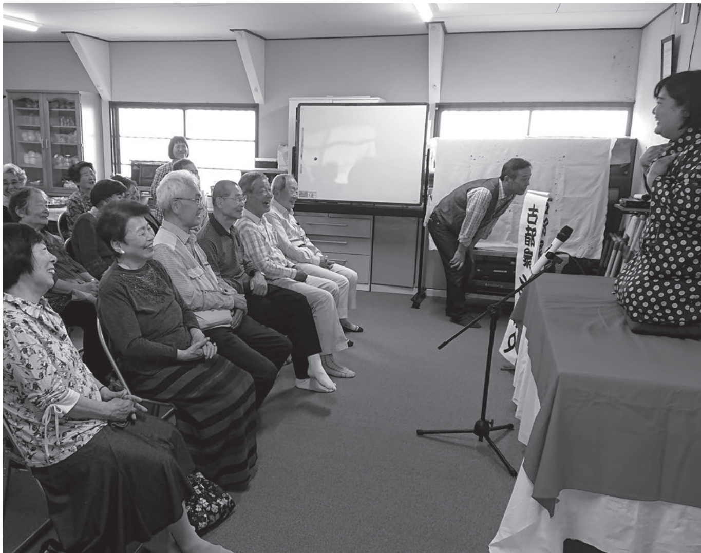
▲紅葉ヶ丘地区福祉会「紅葉会」落語会