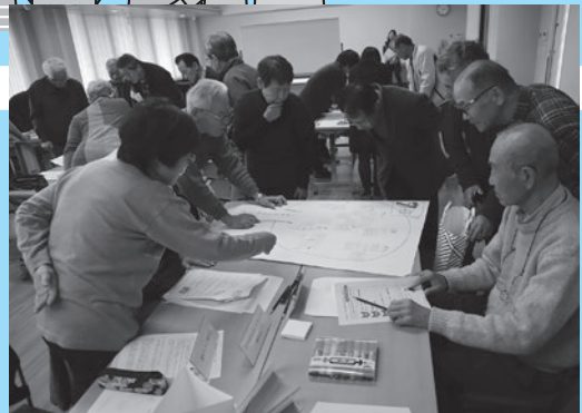
▲小地域福祉会連絡会