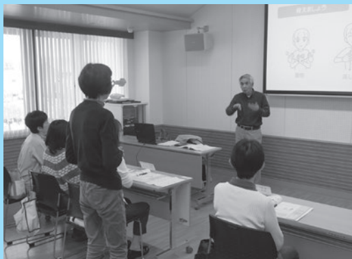
▲手話奉仕員養成講座