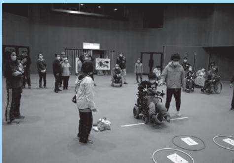
▲ふれあい交流事業