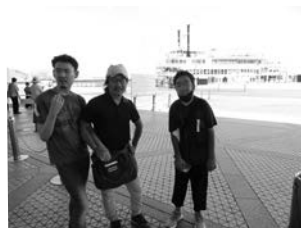
▲ふれあい交流事業