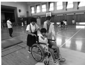
▲出前講座「車椅子体験」