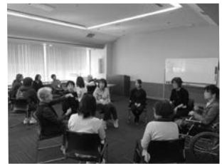
▲手話奉仕員養成講座