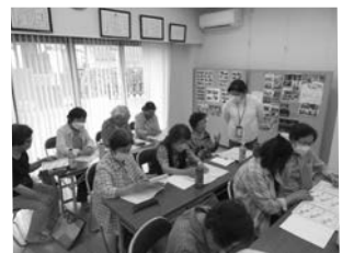
▲つながりワーカー養成講座