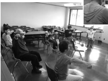
◀地域の介護予防の取組