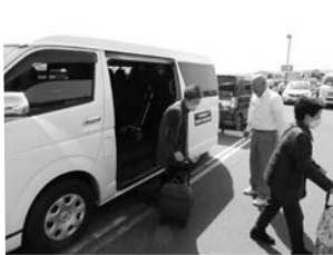
▲紅葉ヶ丘地区福祉会「紅葉会」