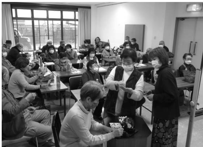
▲法隆寺駅前地区福祉会「たすく会」