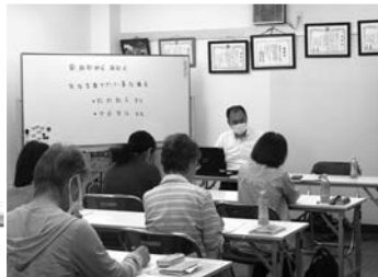
▲生活支援サポーター養成講座

生活支援コーディネーターは地域の支え合いを広げるために、自分たちの地域で生活支援や介護予防、地域のつながりづくりの取り組みについて話し合う、生活支援サポーター講座の実施や、地域の人材、活動を支援することで、地域の力で「できること」をサポートしています。