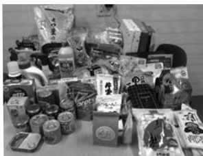
▲まごころドライブに集まった物資