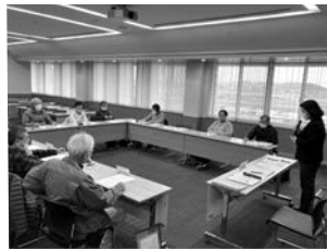
▲小地域福祉会連絡会