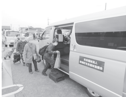
▲買い物支援事業は火・金曜日の午後実施しています。(P7に関連記事)