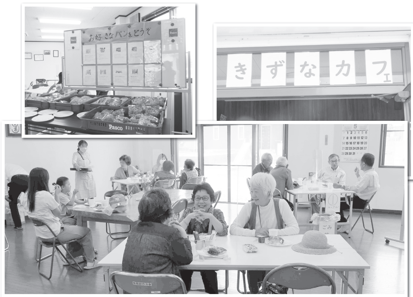
▲南服部自治会 きずなカフェ