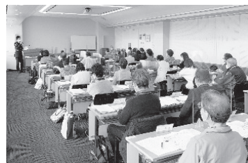
警察による立哨指導

身近に相談しやすいパートナーとして、地域住民の困りごとを聞いて、相談者が必要な支援を受けることができるように、内容に応じて行政サービスを紹介し、窓口につないでいます。