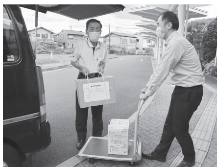
▲まごころドライブには、多くの物資が集まりました。(P4に関連記事)

そして、令和4年度は斑鳩町社協の第5次発展・強化計画の最終年でもあり、外部有識者や役職員による発展・強化計画推進委員会にて、「第6次発展・強化計画」を策定しました。令和5年度からは、策定した計画をもとに、行政や関係団体にも活動への参加・協力をいただきながら、安心して暮らせるまちづくりに取り組んでまいります。