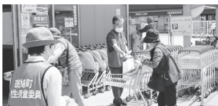
「5月11日 民生委員の日」PR活動

様々な生活の困りごとについて、お住まいの地区の民生・児童委員、主任児童委員に相談してみませんか。