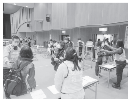
▲災害ボランティアセンター設置運営訓練を生駒郡社協と奈良県防災士会と共同で実施しました。