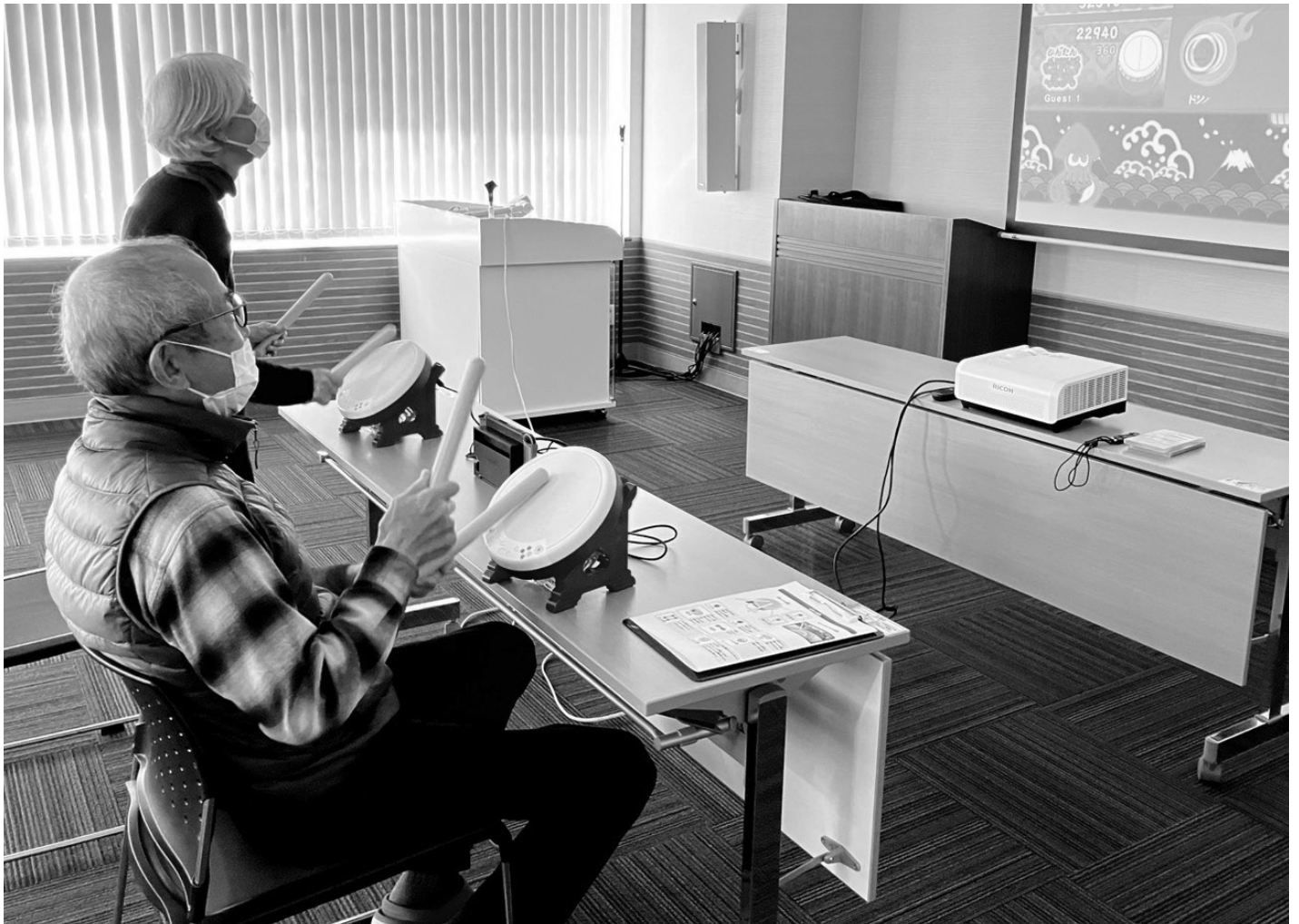
▲いきいき体験教室 「eスポーツ体験」