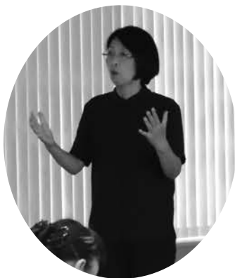
▲今年もボランティアグループ鳩の会の皆様に手話通訳のご協力をいただきました。

皆様のご協力・ご参加により、表彰式典・講演と盛会に開催することができました。誠にありがとうございました。