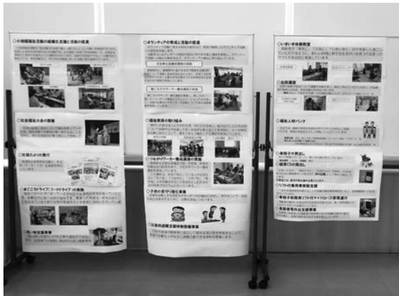
▲社協の活動紹介パネル