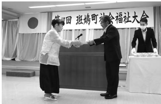
▲式典では寺田会長より、表彰状と記念品が手渡されました

第一部の式典では、多年にわたる社会福祉の推進に貢献された方々への表彰を行いました。